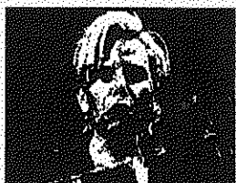
אלט. נחשפת תמונה (ג'חם: מלאט 80)

כתב ההגנה בתביעתה של אינס חושף כיצד ניסתה לתמור זיקן ליצחק באמצעות קשריה עם קצין משטרה - מדגיש: הדיעוה שמורסמו בעניינה לא נבעו לעברית מין אלא לתמיכה מכרז עבדורח בידו הנכ"ל המשרד לביטחון פנים